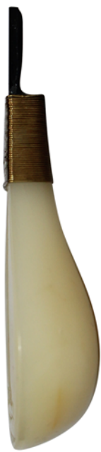
【视图名称】 组件2 右视图