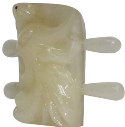
【视图名称】 组件1 立体图