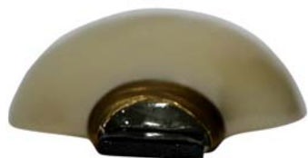
【视图名称】 组件2 俯视图