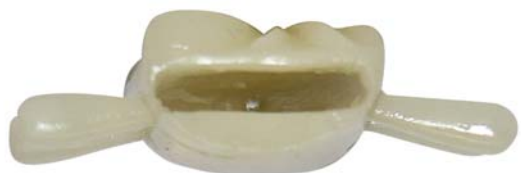
【视图名称】 组件 1 仰视图