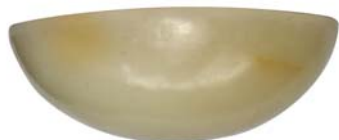
【视图名称】 组件2 仰视图