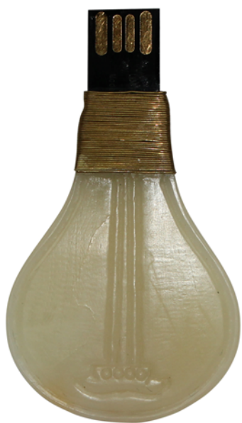
【视图名称】 组件2 主视图