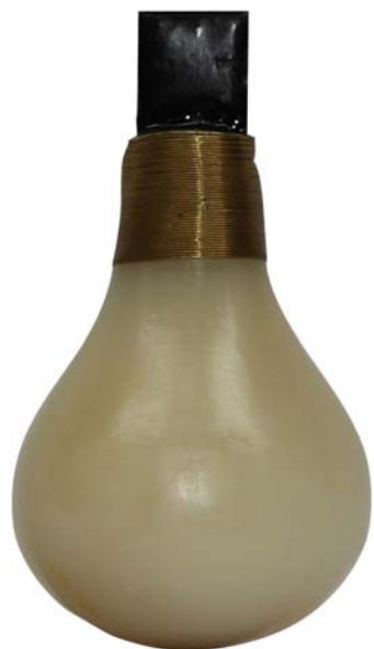
【视图名称】 组件2 后视图