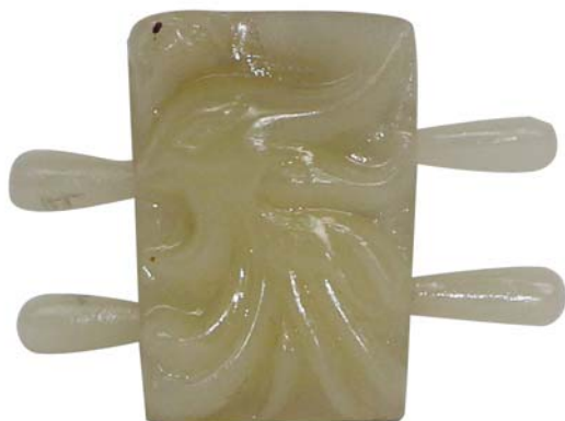
【视图名称】 组件 1 主视图