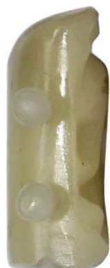
【视图名称】 组件 1 左视图