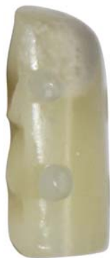
【视图名称】 组件 1 右视图