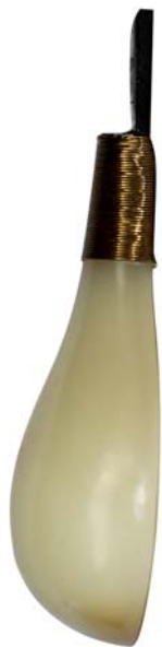
【视图名称】 组件2 左视图