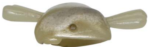
【视图名称】 组件 1 俯视图